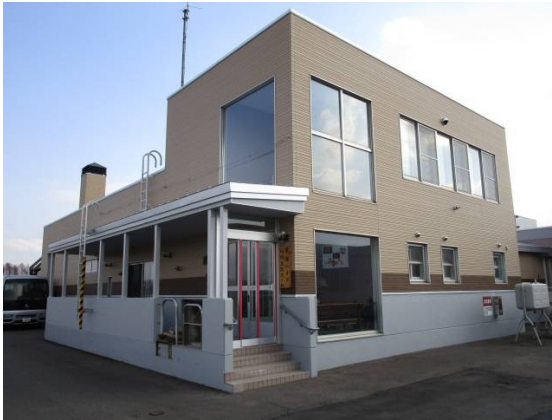
地域交流ホーム（正面）