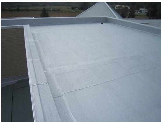
地域交流ホーム（屋上）