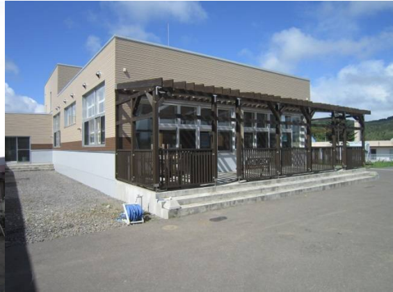
地域交流ホーム（裏手）